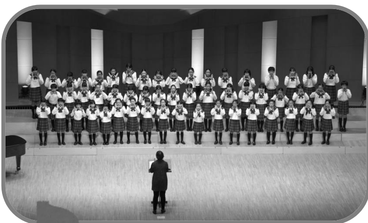
第40回定期演奏会より J1・J2 クラス