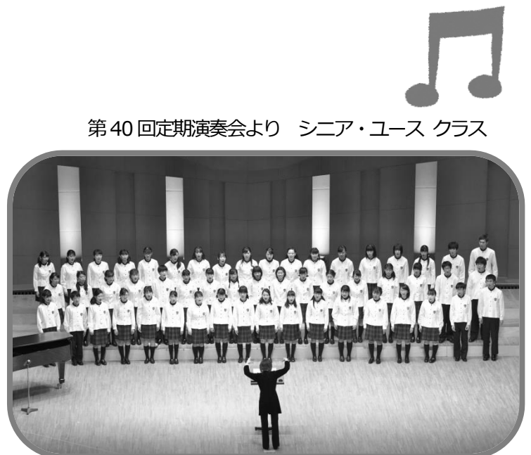
第40回定期演奏会より シニア・ユース クラス