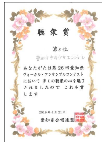
エンジェル聴衆賞 3位