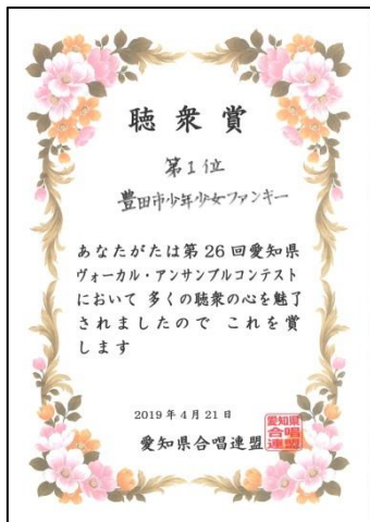
ファンキー聴衆賞 1位